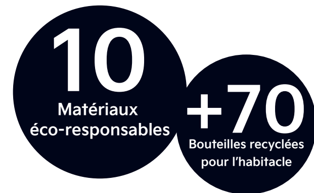
Tableau de bord PET recyclé

En configuration six places avec sièges rotatifs au second rang, EV9 se transforme en lieu de vie, favorisant les moments d'échange ou de partage.