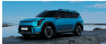
Bleu Océan (exclusivité GT-line)