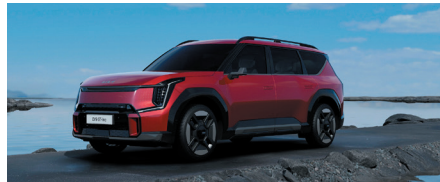
Rouge Volcan (de série)