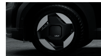
Jantes 19" avec inserts aérodynamiques (Earth)