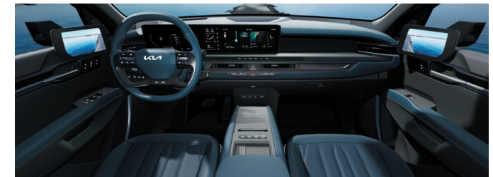
Environnement intérieur cuir végétal artificiel GT-line Bleu Maritime / Gris Ardoise