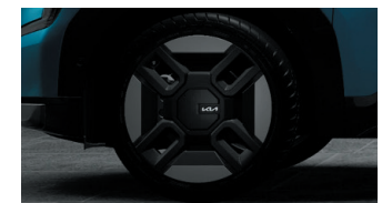
Jantes 21" avec inserts aérodynamiques (GT-line)