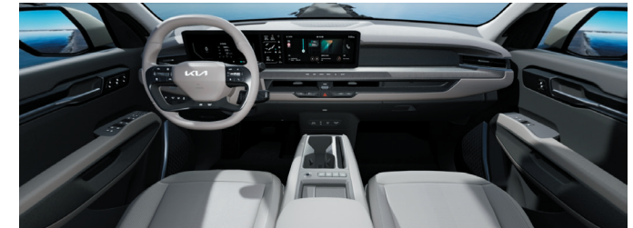
Environnement intérieur cuir végétal artificiel Gris Ardoise / Gris Ecume