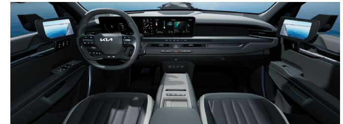
Environnement intérieur cuir végétal artificiel GT-line Noir Abysses / Gris Ecume