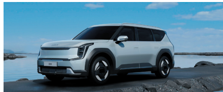
Gris Ivoire (exclusivité Earth)