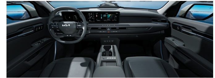
Environnement intérieur cuir végétal artificiel Noir Abysses / Gris Ardoise