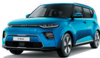
Bleu Cobalt (SRB)