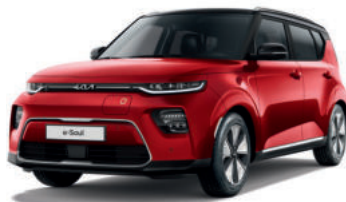
Rouge Inferno / Toit Noir Fusion (FA2)