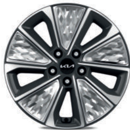
Jantes en alliage de 17" finition diamantée