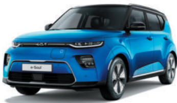
Bleu Neptune / Toit Noir Fusion (FB1)