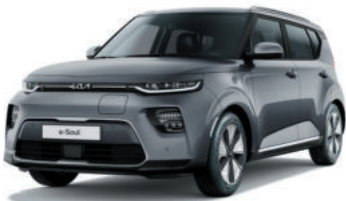
Gris Gravité (KDG)*