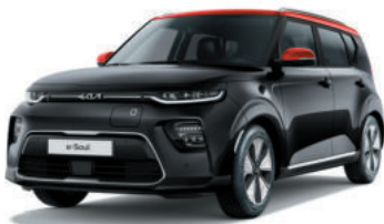
Noir Fusion / Toit Rouge Inferno (FA1)