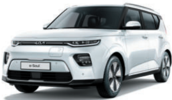
Blanc Nacré (SWP)*