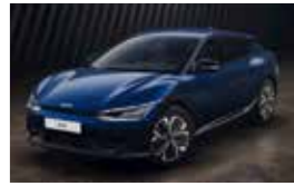
Bleu Pacifique (DU3)* Peinture métallisée gratuite