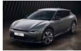
Gris Comète Mat (KLM)***