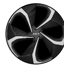
Noir laqué 20" (en option)