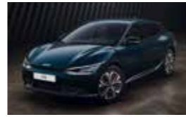
Bleu Saphir (B4U)* Disponible uniquement sur EV6 Active et EV6 Design