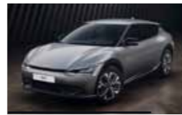
Gris Comète (KLG)* Disponible uniquement sur EV6 Active et EV6 Design