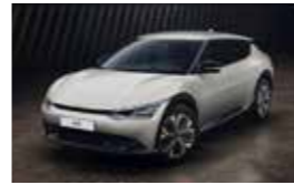
Blanc Glacier (GLB)* Disponible uniquement sur EV6 Active et EV6 Design