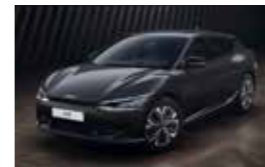
Gris Cosmique (AGT)* Disponible uniquement sur EV6 Active et EV6 Design