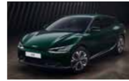
Vert Amazone (G4E)* Disponible uniquement sur EV6 Active et EV6 Design