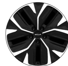
Noir laqué 20" (en option uniquement sur EV6 Design)