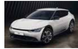
Blanc Nacré (SWP)**