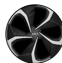
Gris anthracite métallisé 19"