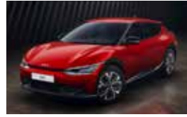
Rouge Magma (CR5)*

* Peinture métallisée ** Peinture nacrée *** Peinture mate (1) Disponible à partir de 2022