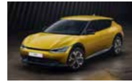
Jaune Pasadena (UBY) (1) Disponible uniquement sur EV6 Active et EV6 Design