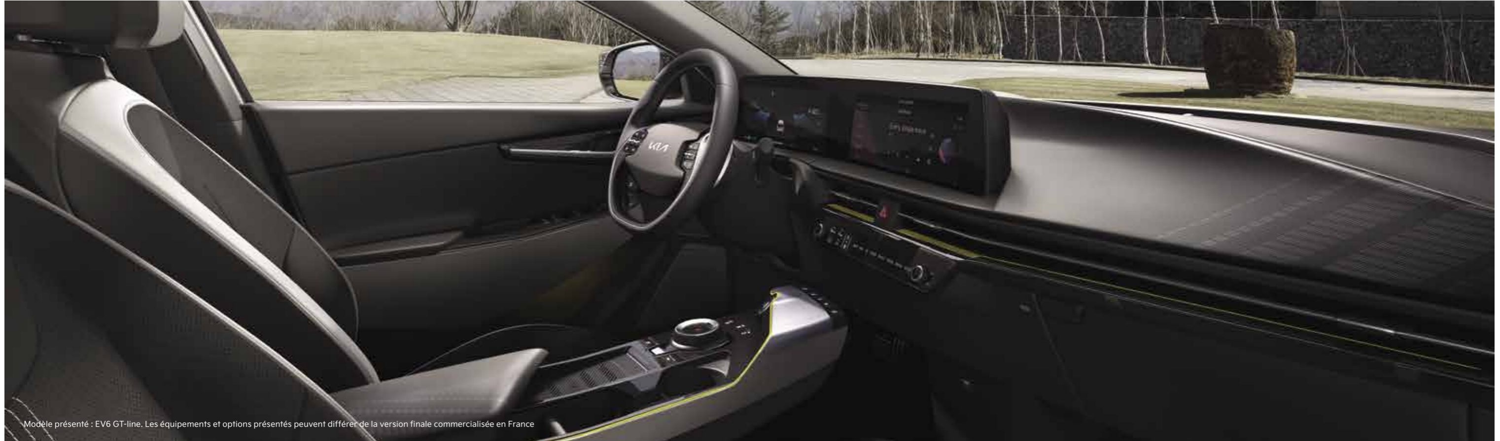
Modèle présenté : EV6 GT-line. Les équipements et options présentés peuvent différer de la version finale commercialisée en France