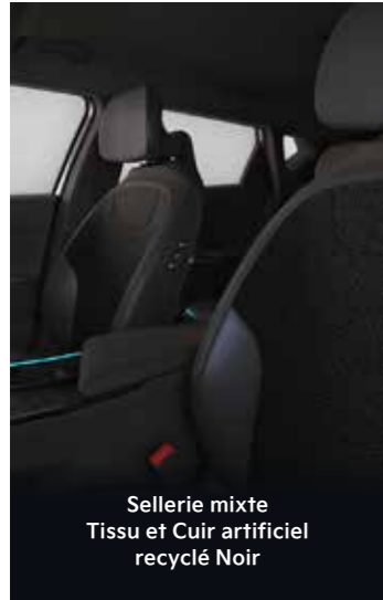
Finition EV6 Active