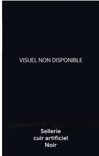
Finition EV6 Design