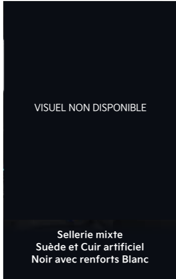
Finition EV6 GT-line