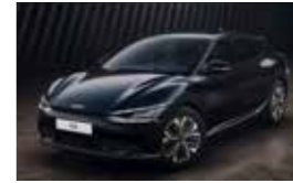
Noir Ebène (ABP)*