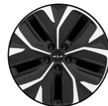
Gris métallisé 19"